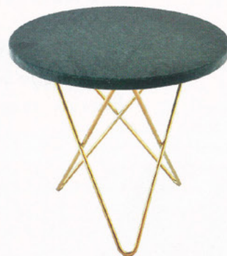
STOLIK OX DENMARQ

GDZIE SPOTKAĆ? LOBBY Hit dizajnu. Od 60 lat i od trzech pokoleń.