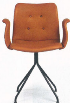
KRZESŁO PRIMUM BENT HANSEN

GDZIE SPOTKAĆ? LOBBY Hit dizajnu. Od 60 lat i od trzech pokoleń.