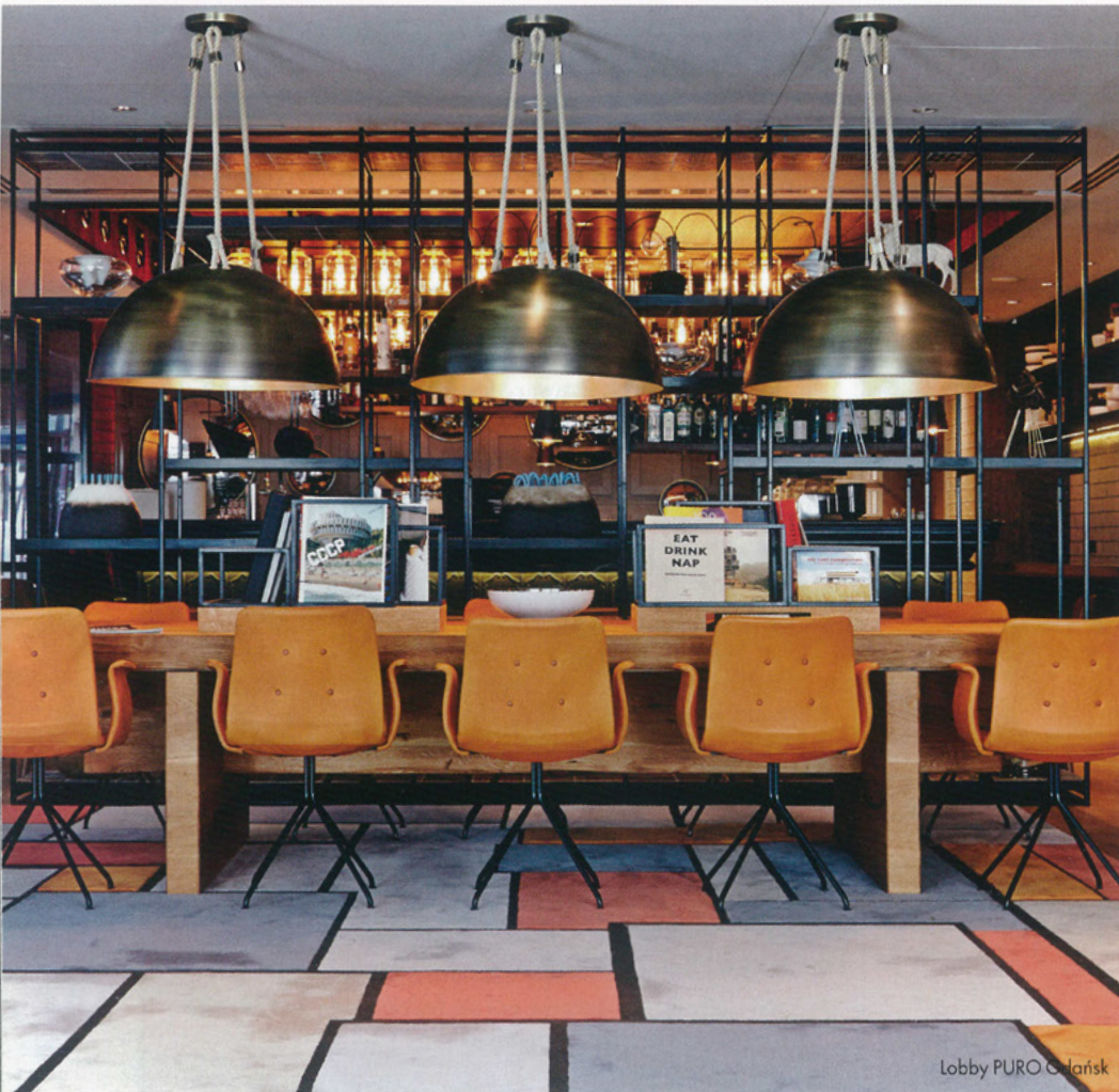
Lobby PURO Gdańsk

Nie zachwyciłyby laureatów „Randki w ciemno”, bo nie ma biczów wodnych i zjeżdżalni do basenu. I dobrze. Hotele PURO to zupełnie nowa jakość hoteli na polskim rynku.