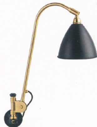
LAMPA GUBI, MODEL BESTLITE

GDZIE SPOTKAĆ? W POKOJU Zdobyli Wallpaper Design Award. Prototyp tego krzesła powstał w 1955 r.