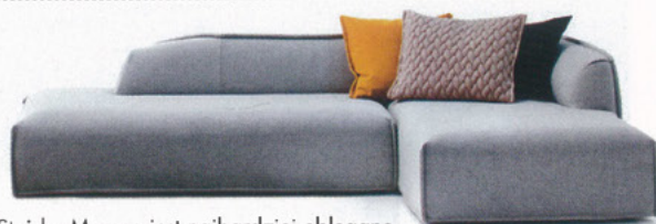
SOFA MOROSO, Z KOLEKCJI MASSAS

Stoisko Moroso jest najbardziej oblegane na Salone del Mobile. A ta sofa najbardziej oblegana w hotelowym lobby.