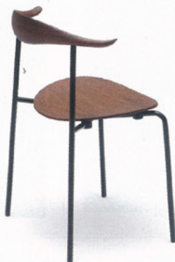
KRZESŁO CARL HANSEN & SON

GDZIE SPOTKAĆ? W POKOJU Zdobyli Wallpaper Design Award. Prototyp tego krzesła powstał w 1955 r.